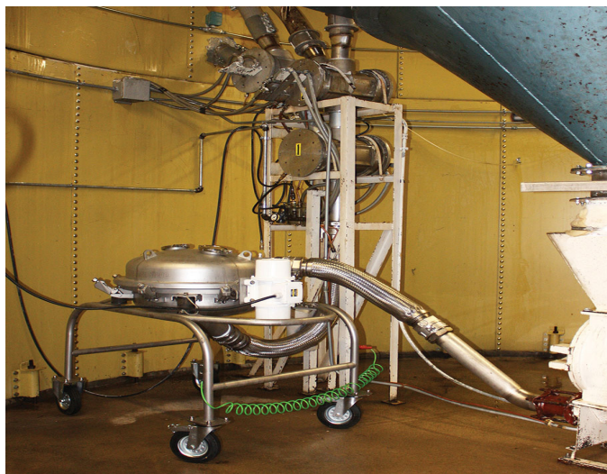
Image 1 : Le tamiseur Blow Thru Sieve tamise le sucre après son passage à travers un silo